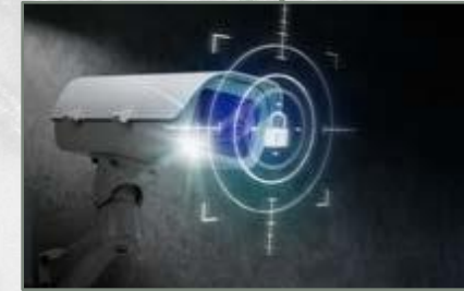
CCTV 24 Jam, Keamanan G Pemadam Kebakaran