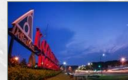
Lokasi yang Strategis