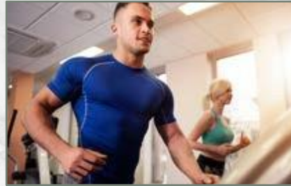
Pusat Arena Olahraga