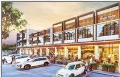
Area Bisnis G Komersil