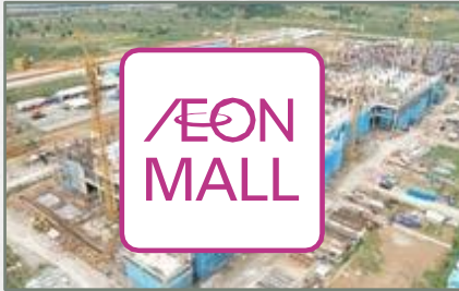
AEON Mall terbesar di Indonesia (Under Construction)

Nikmati segala fasilitas dan nilai lebih deSilva Residence