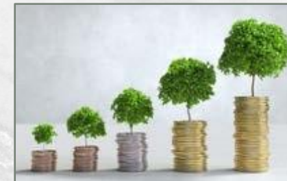
Investasi yang Prima