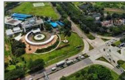
Akses Masuk Jalan Utama