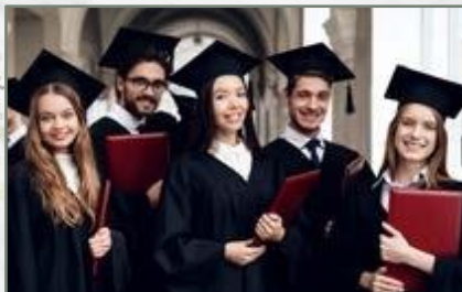
Sekolah G Universitas